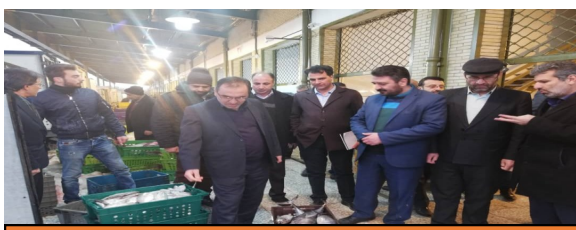
بازدید از بارانداز ماهی سازمان مشاغل شهری