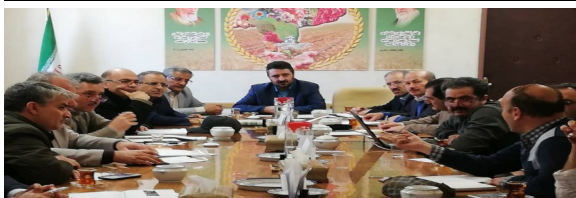
کارگروه احیاء و تعادل بخشی آبهای زیرزمینی