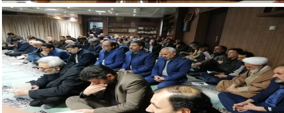
مراسم گرامیداشت شهادت سردار سپهبد شهید حاج قاسم سلیمانی

راه های ارتباطی: تلفن: ۳۷۹۱۳۲۱۷ پیامک: ۰۷۳۹۱۰۰۰ آدرس الکترونیکی: www.agri-es.ir